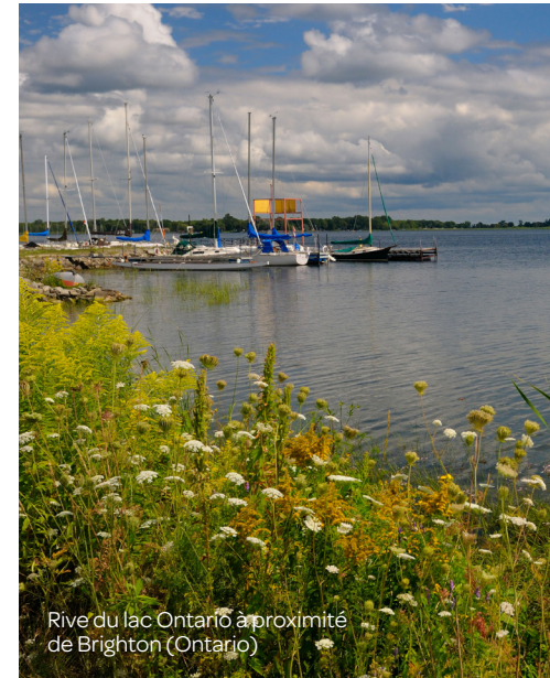
Rive du lac Ontario à proximité de Brighton (Ontario)

Le Conseil peut maintenant utiliser cet outil supplémentaire qui lui propose des cartes, des tableaux et des graphiques montrant l'évolution possible des niveaux d'eau et des impacts connexes suivant une certaine stratégie de régularisation. L'outil est alimenté par des données recueillies sur les impacts des crues extrêmes de 2017, de 2019 et du début de 2020, ainsi que par d'autres renseignements recueillis par le Comité GAGL et ses associés. De plus, grâce aux réponses à un questionnaire en ligne sur les impacts, l'outil puise dans le contenu de plus de 3 000 réponses de propriétaires riverains.