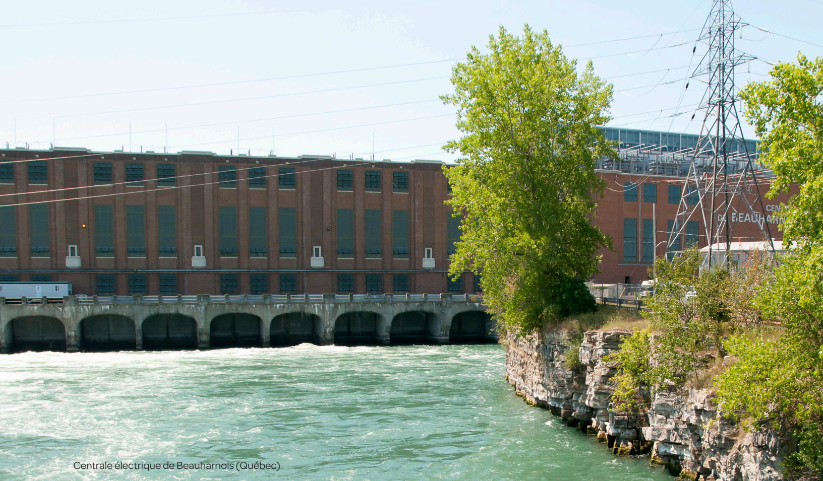
Centrale électrique de Beauharnois (Québec)