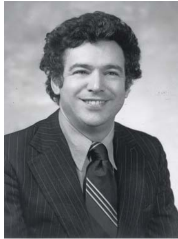
Avocat et professeur

Né le 29 mai 1938 à Meridan, au Connecticut.